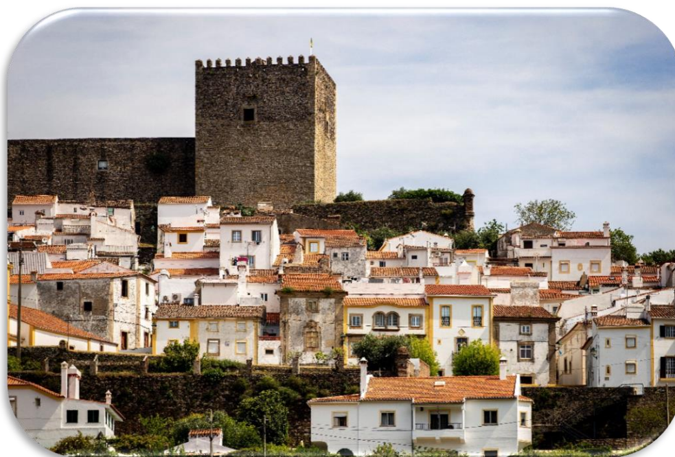
Castelo de Castelo de Vide