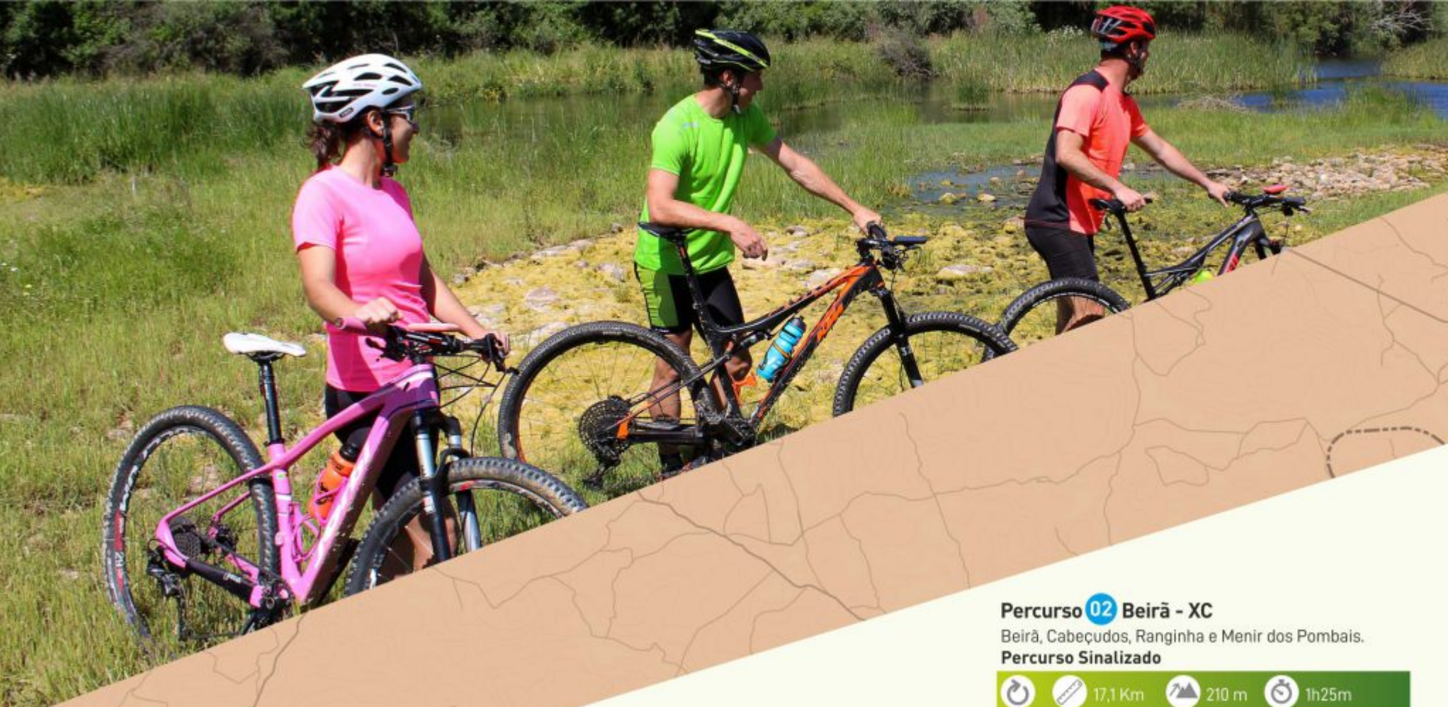
Póvoa e Meadas